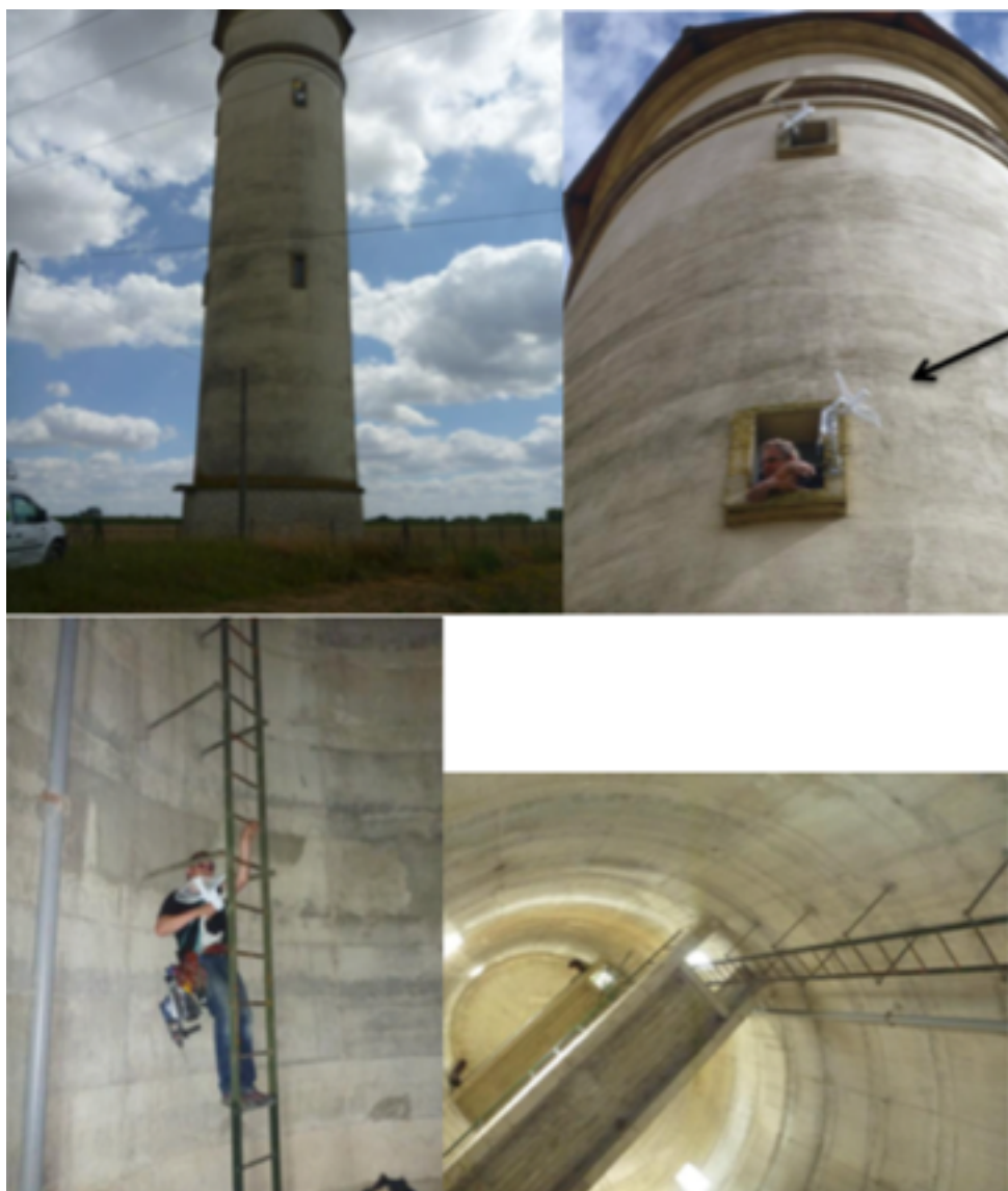
Photos d'une installation Scani par l'association cœur de fibre