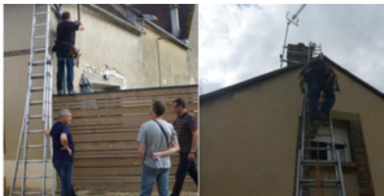
Photos d'une installation Scani par l'association cœur de fibre

Signature (enfin) des conventions de relais pour inclure Grandchamp : ce secteur, juste là très compliqué à couvrir devrait pouvoir l'être sous peu grâce à deux habitant-relais, l'un sur Charny et l'autre sur Grandchamp... via Taingy. La perspicacité de l'une de nos membre actif bénévole de Scani est à saluer dans cette réussite pour raccorder Grandchamp !